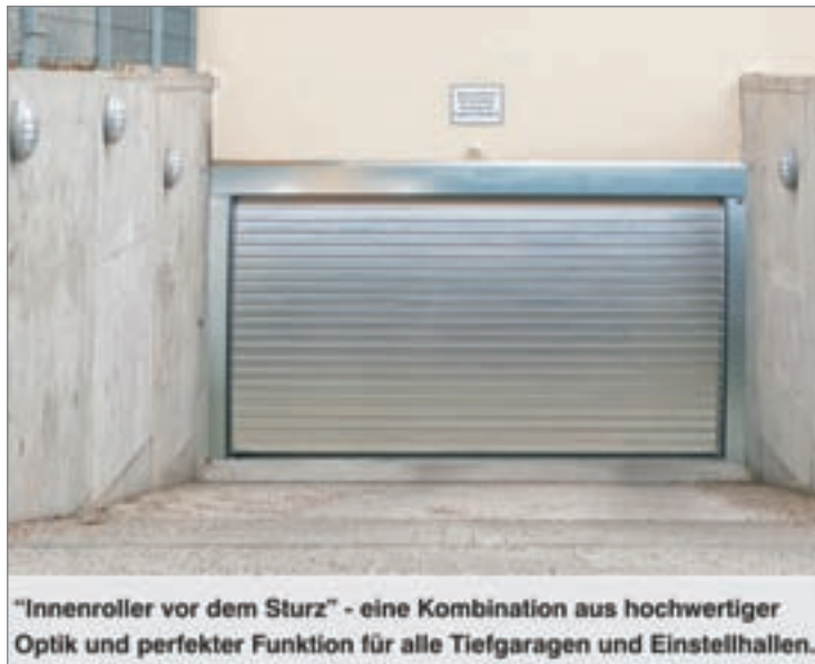
"Innenroller vor dem Sturz" - eine Kombination aus hochwertiger Optik und perfekter Funktion für alle Tiefgaragen und Einstellhallen.

Die Stellplätze sind wieder voll nutzbar!